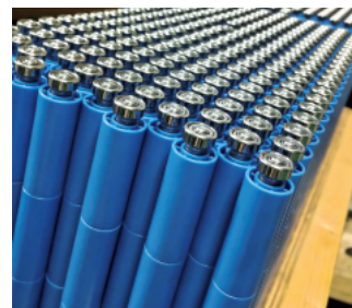
【組立品の一例】 物流システムメーカー様向けアセンブリ