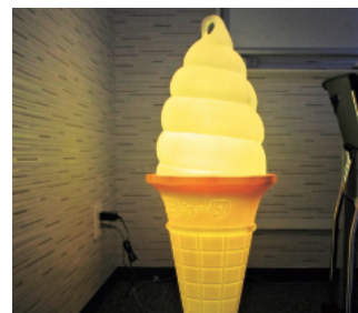
【LED 関連製品の一例】 フルカラー!ソフトクリーム看板